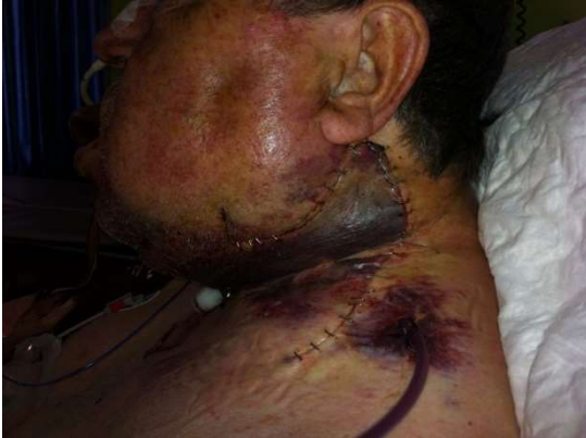
Figura 3. Hematoma cervical izquierdo 48 horas tras la segunda intervención.