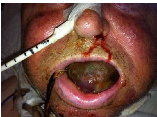
Figura 2. Hematoma lingual 48 horas tras la primera intervención.