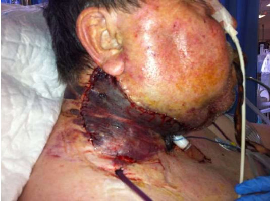
Figura 4. Hematoma cervical derecho 48 horas tras la segunda intervención.