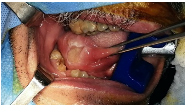
Figura 1. Coristoma óseo en borde lateral de lengua.