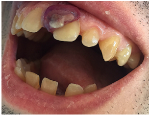
Figura 1. Tumoración exofítica hiperqueratósica, rojo-violácea, de bordes bien definidos, de 1 x 1,5 cm en encía adherida entre piezas 21 y 11.