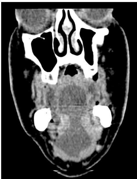
Figura 2. Aspecto de la lesión en corte coronal de TAC. Imagen hipodensa en “reloj de arena”.