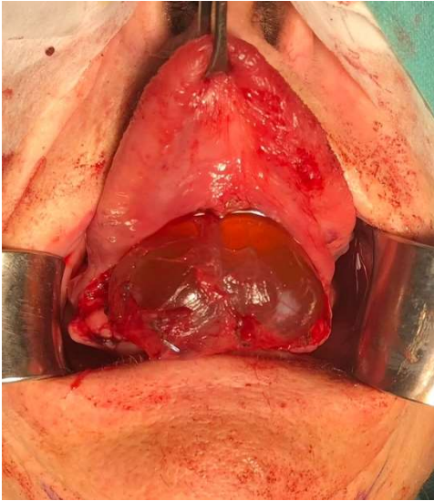
Figura 3. Abordaje intraoral con exposición de la lesión. Al trasluz se evidencia una tumoración de aspecto quístico.